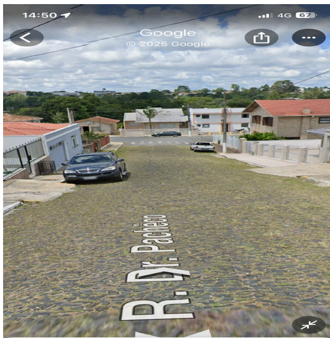
85 R. Dr. Pachêco